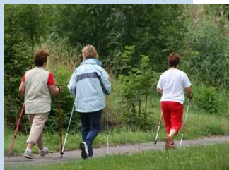
In der Natur bewegen