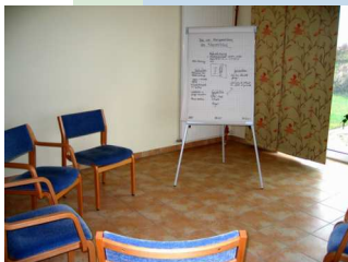
Über die Krankheit lernen