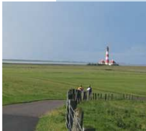
Neue Wege gehen

Sonstige Intoleranzen, insbesondere von Nahrungsmitteln, Allergien, Stoffwechselerkrankungen und seelische Störungen.