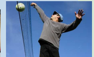
Mit Spaß bewegen