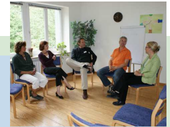
Über die Krankheit lernen