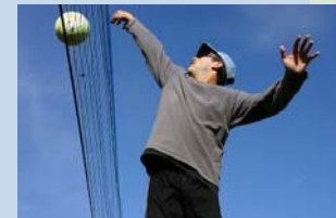
Mit Spaß bewegen