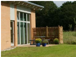
die Fachkliniken Nordfriesland in Riddorf