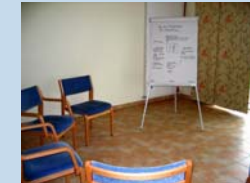
Über die Krankheit lernen