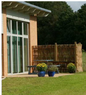
die Fachkliniken Nordfriesland in Riddorf