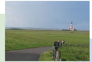
Neue Wege gehen