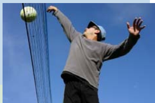
Mit Spaß bewegen