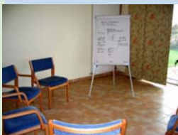
Über die Krankheit lernen