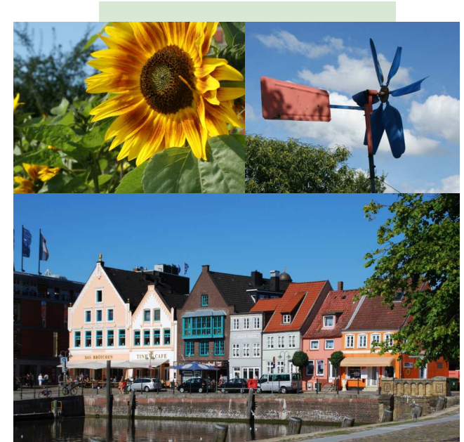
Husum in Nordfriesland