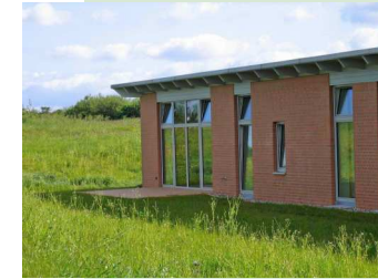
die Fachkliniken Nordfriesland in Riddorf