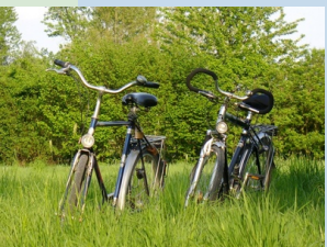
Mit Spaß bewegen