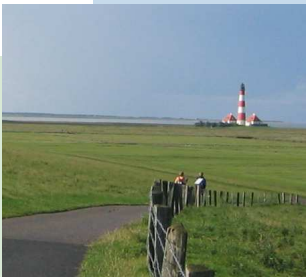
Neue Wege gehen