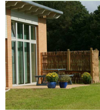
die Fachkliniken Nordfriesland in Riddorf