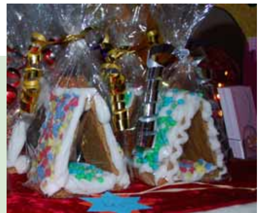
Fotos von dem weihnachtlichen Basar der Fachkliniken Nordfriesland in Breklum: S. 19