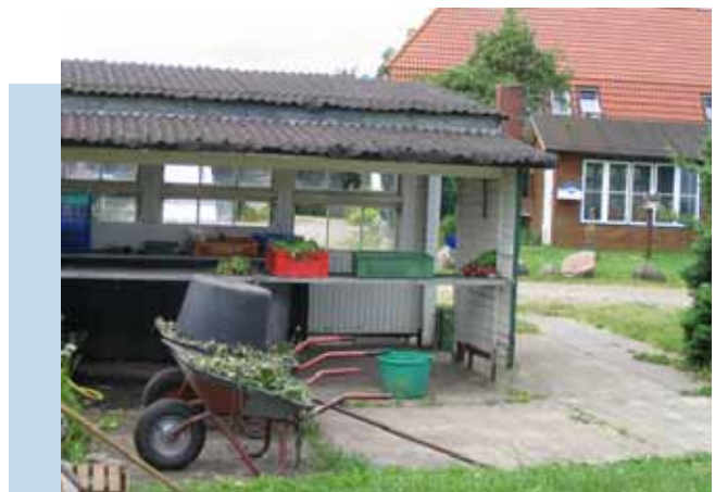
Übergangseinrichtung Hof Tarpfeld

Die Erstellung erforderlicher Auswertungen im Sinne eines Controllings auf der Basis von Zahlen, Daten und Fakten soll in Zukunft kurzfristiger möglich werden, damit auf Veränderungen schneller reagiert werden kann. Eine schnelle Hilfe wäre aus Sicht der GF für die Übergangseinrichtung Tarpfeld erforderlich gewesen, nachdem die Erlöse dort schlagartig einbrachen. Veränderungen konnten jedoch erst mit einer Verzögerung von einigen Monaten realisiert werden. In Tarpfeld haben wir der Bitte der vorherigen Leitung entsprochen, die Position neu zu besetzen. In der GF haben wir zahlreiche Gespräche geführt und entschieden, die Übergangseinrichtung der Abteilung für Rehabilitation zu unterstellen. Dr. Rainer Petersen hat mit dieser Entscheidung die Gesamtverantwortung auch für Tarp-