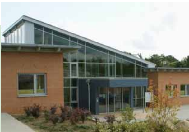
Der Standort Riddorf