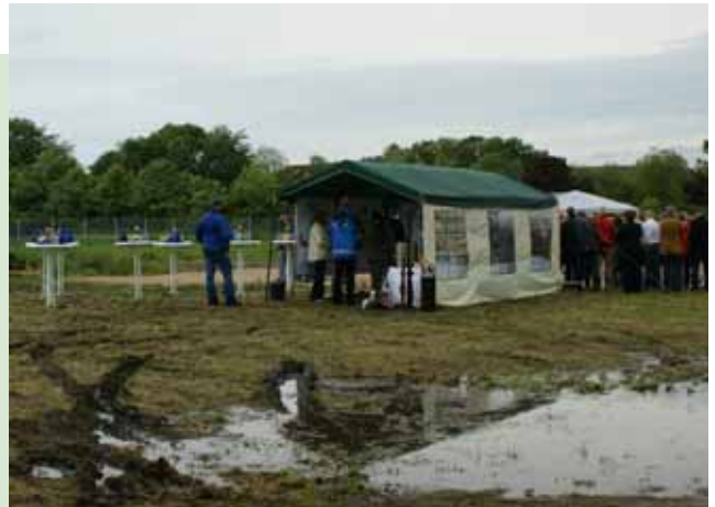
Starkregen vor der Grundsteinlegung in Niebüll

Bereits am 13.11. wurde die Zielkonferenz für das Jahr 2010 durchgeführt. Über die verabschiedeten Ziele und Erfordernisse wird hier und später berichtet.