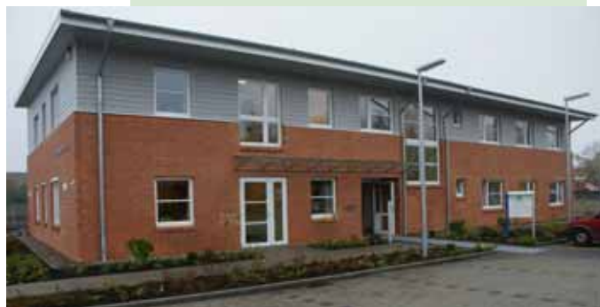
Das Anne Müller Haus in Niebüll

Auch die Zusammenarbeit mit dem Klinikum Nordfriesland soll ausgebaut und vertieft werden.