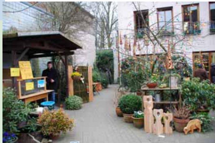
Der Krokusblütenmarkt der Husumer Insel