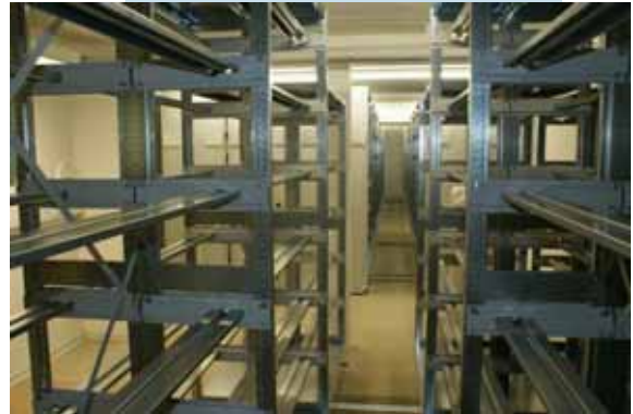
600 m Hängeregister