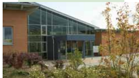
Standort in Riddorf