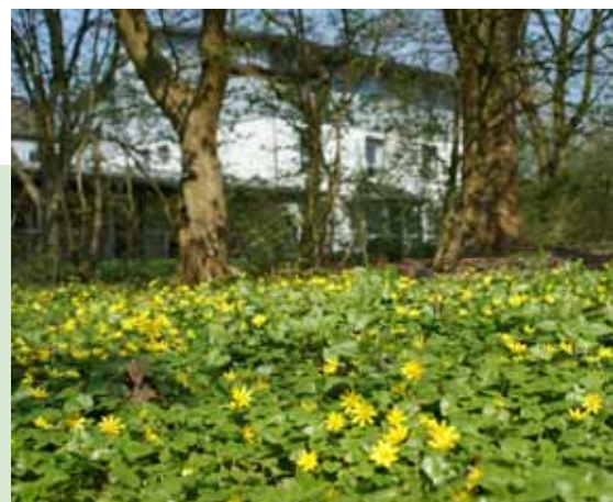
Die Fachkliniken Nordfriesland im Frühling