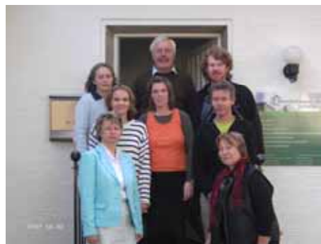
Team des Suchthilfezentrums

Dies ist ein Arbeitsprojekt nach SGB XII der Eingliederungshilfe mit 18 Plätzen für psychisch Behinderte. Die Arbeit verteilt sich auf mehrere Arbeitsbereiche wie Flohmarktladen, Fahrradwerkstatt, Holzwerkstatt und Textilbereich. Die Angebotswerkstatt befindet sich in der Friedrichstraße in Schleswig.