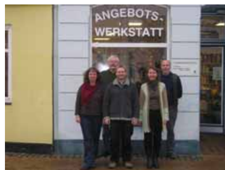
Team der Angebotswerkstatt

Der Begriff wurde erstmals 1959 in den USA verwendet. Als Diagnose existiert der Begriff jedoch erst seit den 1990er Jahren. Die Definition dieser Essstörung war längere Zeit umstritten, die Kriterien werden von Ernährungswissenschaftlern und Medizinern jedoch zunehmend akzeptiert; die Behandlungsbedürftigkeit dieser Störung wird auch in Europa mittlerweile überwiegend anerkannt. Die Behandlungskonzepte entsprechen in der Regel denen der Bulimie.