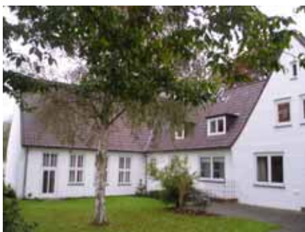
Schleswig, Suadicanistr. 45