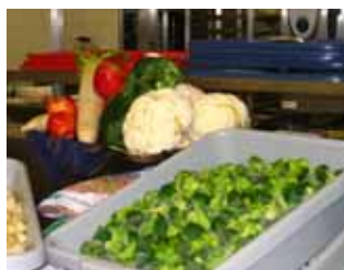
Frisches Gemüse und TK

Die Bewertungen der Patienten sind jetzt wieder angestiegen und das Leitungsteam ist zuversichtlich, dass 2008 wieder ein guter Standard erreicht wird. Es werden schon Neuerungen geplant, die vielen von uns (fast täglich) zu Gute kommen werden.