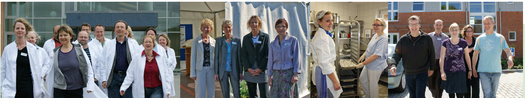
Die Mitarbeiter der Fachkliniken Nordfriesland entwickeln ein Leitbild: Quer durch alle Berufsgruppen und über alle Standorte

Wir sind loyal mit einer Hierarchie, die klar und wertschätzend agiert, verstehen und zuhören will, einbezieht und Austausch fördert, Fragen stellt und nichts ausschließt, Bindung vermittelt und Autonomie stärkt, sich stark macht im Sinne des Auftrags und das Außen einbindet, die um jeden Mitarbeiter wirbt, eigene Grenzen erkennt und entsprechend delegiert.